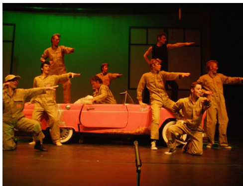
Grease als smeerolie