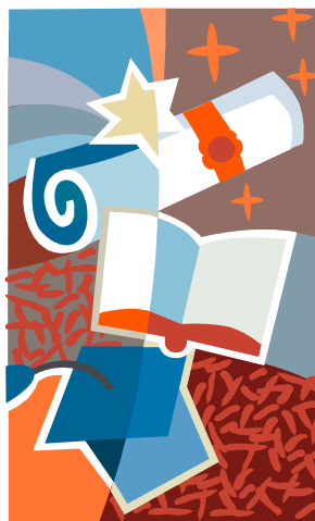
5 deelcertificaten = 1 O&O-certificaat

Samen met de regionale projectleiders inventariseren Judith en Boris momenteel welke docenten nu al in aanmerking komen voor hun O&O-certificaat.